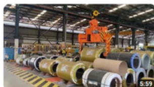
Safety Story 1