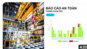
NS BLUESCOPE- OHSE NEWS (JULY 21)