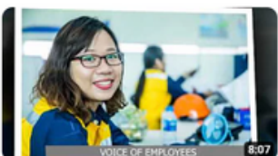
OCT.22|OHSE NEW (2)