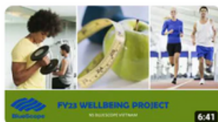
Sept.22| OHSE New