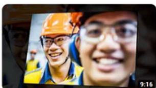
Nov.22| OHSE New