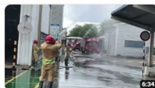
OHSE Standard Setup for Customer Factory