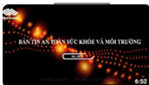
Apr 22| OHSE News