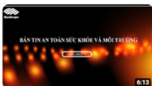
Mar 22| OHSE NEWS