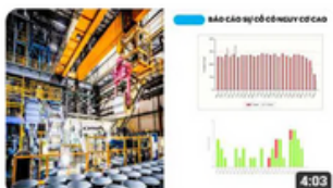
NS BLUESCOPE- OHSE News (AUG.21)