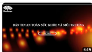
Feb. 22| OHSE News